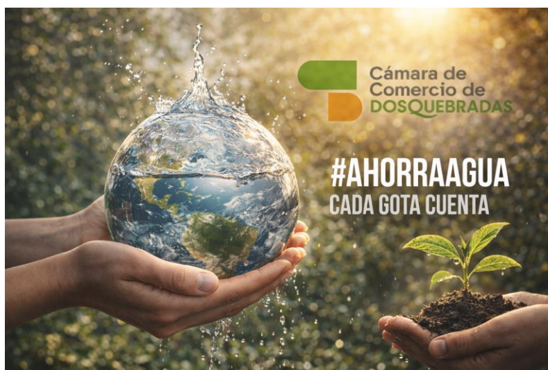
Imagen / Campaña #AhorraAgua

Las acciones de control, revisión, calibración y cambio de grifos en lavamanos y sanitarios de mecanismos ahorradores de acuerdo a la necesidad, inspecciones de las condiciones de la tubería y campañas de concientización del buen uso del recurso hídrico, tales como tips y consejos para consumir de manera responsable este recurso.