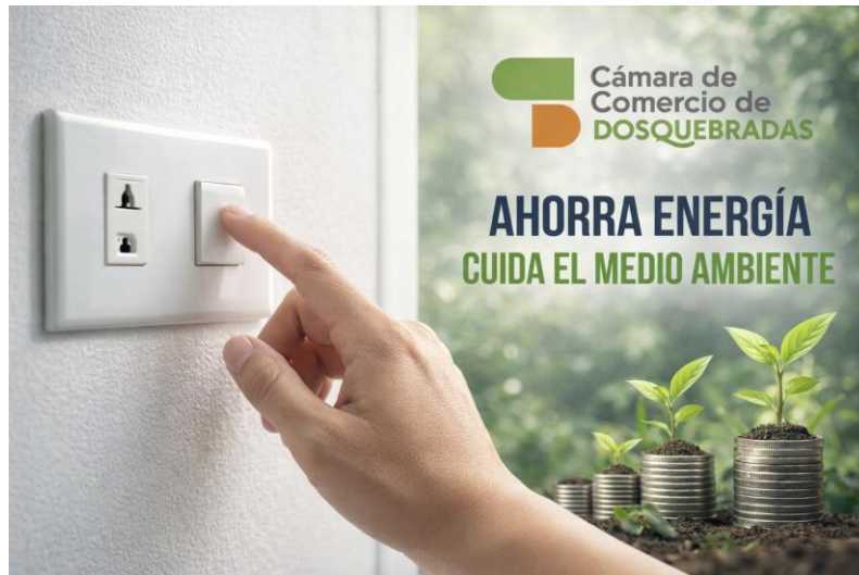
Imagen / Campaña sobre el ahorro de energía

Durante los últimos años se vienen adelantando campañas sobre el ahorro y uso eficiente de la energía, a través de los medios de comunicación institucional como herramientas para publicar y orientar la toma de conciencia frente a la importancia de los recursos naturales.