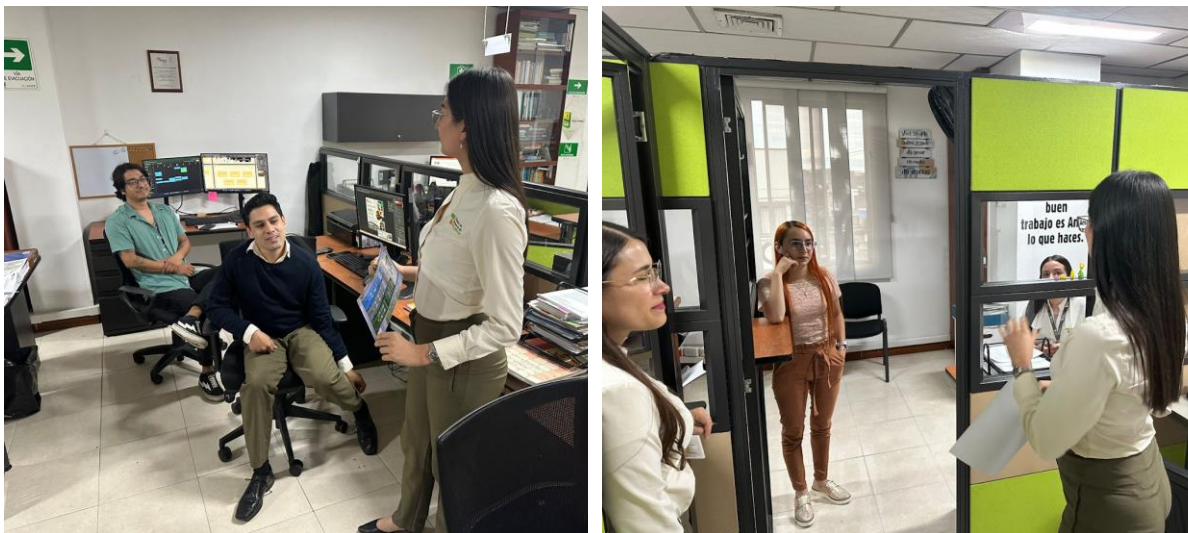
Imagen /Capacitación y sensibilización ambiental a colaboradores.

La capacitación buscó concientizar a los colaboradores sobre su rol en la gestión ambiental de la entidad y el cumplimiento de las directrices institucionales relacionadas con el manejo responsable de los recursos.